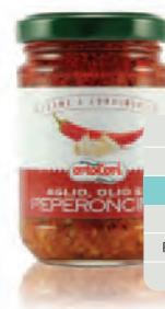
Aglio, Olio e Peperoncino