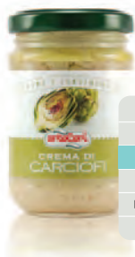
Crema di Carciofi