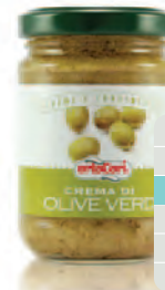
Crema di Olive Verdi