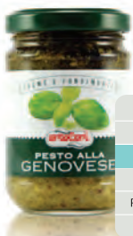
Pesto alla Genovese