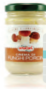
Crema di Funghi Porcini