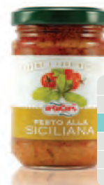
Pesto alla Siciliana